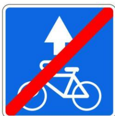
Конец полосы для велосипедистов