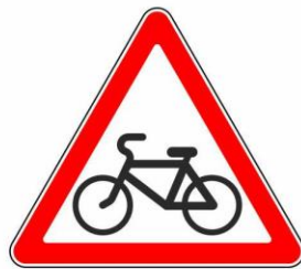
Пересечение с велосипедной дорожкой или велопешеходной дорожкой