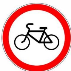
Движение на велосипеде запрещено