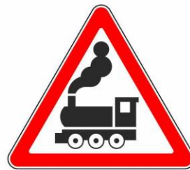
Железнодорожный переезд без шлагбаума