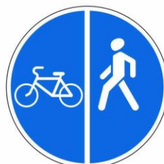
Пешеходная и велосипедная дорожка с разделением движения