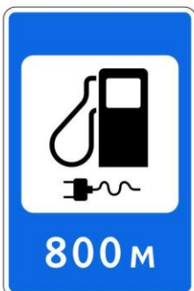
Автозаправочная станция с возможностью зарядки электромобилей