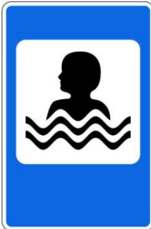
Бассейн или пляж