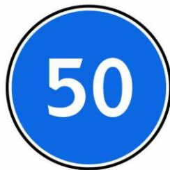
Ограничение минимальной скорости