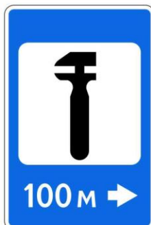
Техническое обслуживание автомобилей