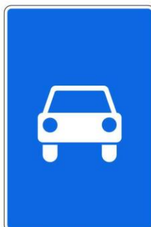
Дорога для автомобилей