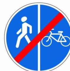
Конец пешеходной и велосипедной дорожки с разделением движения