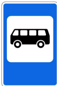
Место остановки автобуса и (или) троллейбуса