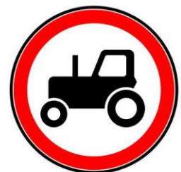
Движение тракторов запрещено