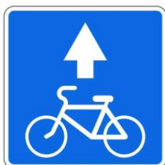
Полоса для велосипедистов