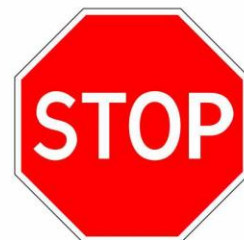
Движение без остановки запрещено