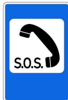
Телефон экстренной связи