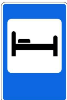
Гостиница или мотель