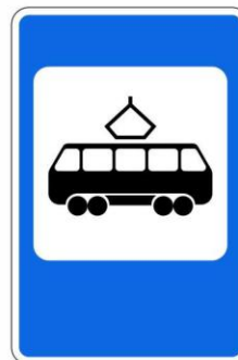
Место остановки трамвая