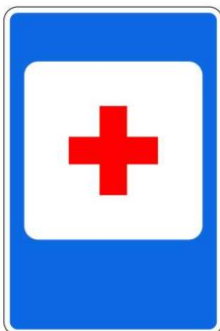
Пункт первой медицинской помощи